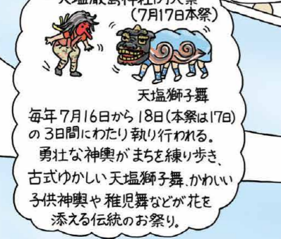
天塩神社例大祭 (7月17日)

天塩獅子舞 毎年7月16日から18日(本祭は17日)の3日間にわたり執り行われる。勇壮な神輿がまちを練り歩き、古式ゆかしい天塩獅子舞、かわいらしい子供神楽や稚児舞などが花を添える伝統のお祭り。