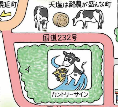
天塩は酪農が盛んな町